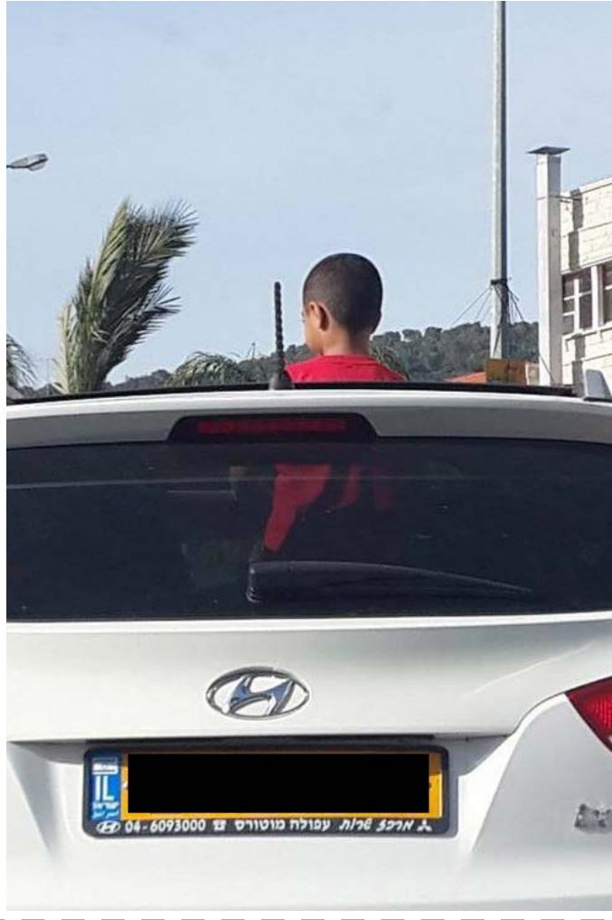
תשובה: הילד אינו יושב ברכב בצורה בטיחותית ואינו חגור