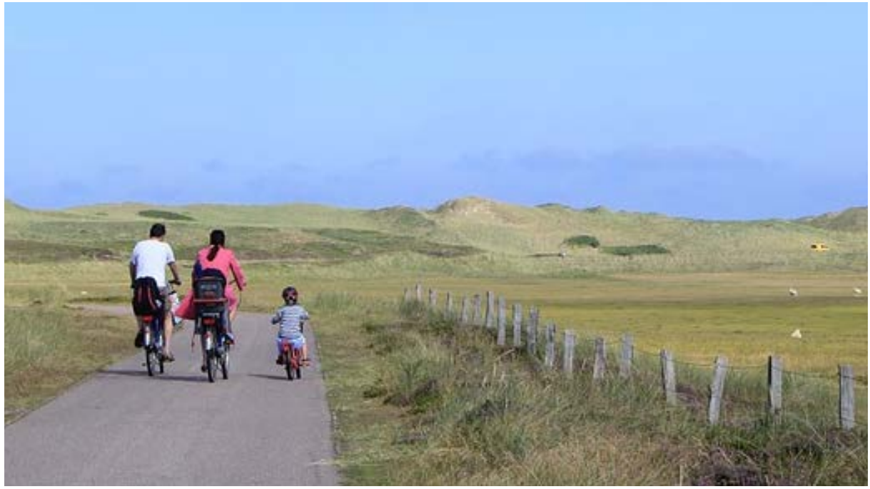
תשובה: השגיאה היא שההורים אינם חובשים קסדות