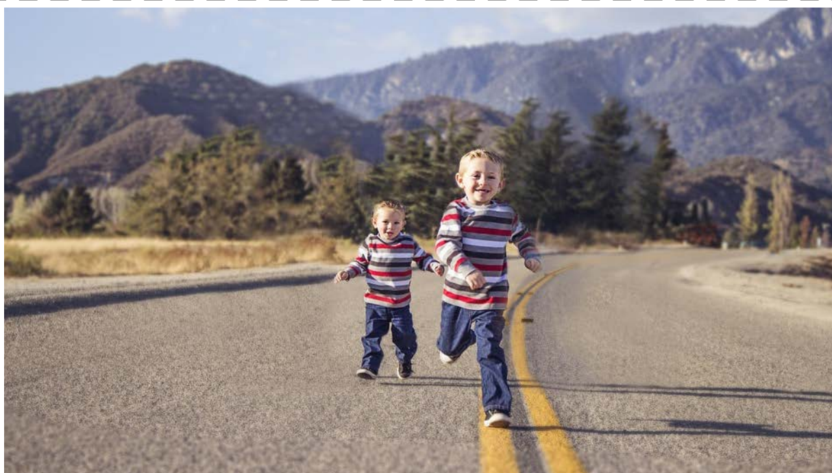
תשובה: הילדים משחקים על הכביש