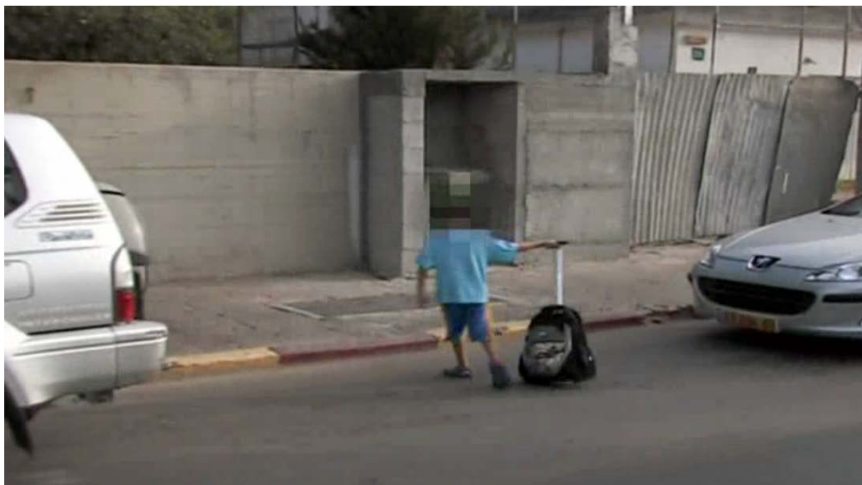
תשובה: ילד חוצה כביש ללא מעבר חצייה בין מכוניות המסתירות אותו